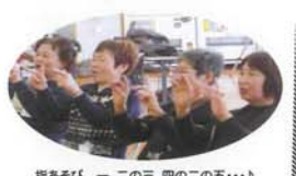
指あそび 一、二の三四の五…♪