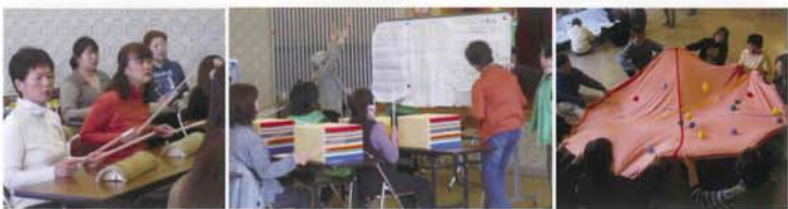
手作り楽器のたいこ合奏♪♪ あんたがたどこさ みんなで作れ出す音、だんだん一つになってきます シーツ玉入れ 大興奮!!