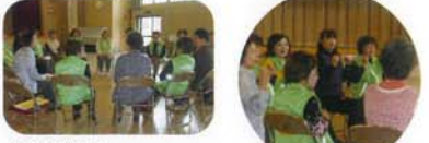
自己紹介（観察） ウォーミングアップのゲームから