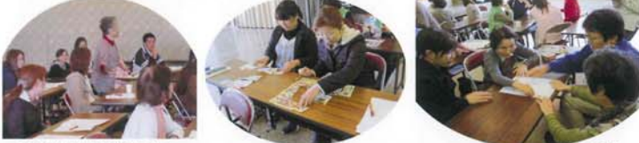
言葉あつめ「あ」から始まるものは… 広告/パズル おっかけ特撰