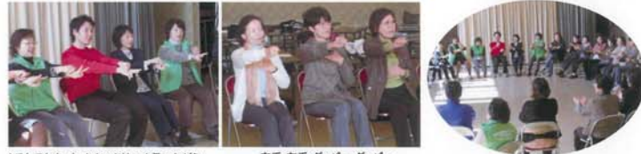
♪でんでん虫、かたつむり…と歌いながら 右手、左手、グーパー・グーパー みんなで輪になり、頭と指のウォーミングアップ