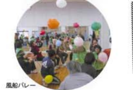
風船パレード 集団のゲーム