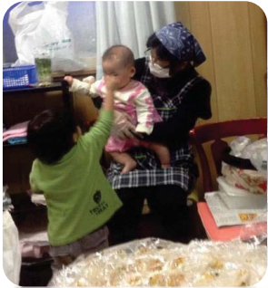
赤ちゃんは人気者

いつもお婆ちゃん料理を作ってお下さる 方が、今日は牛蒡のきんぴらを持って 来て下さいました。とても味が良く、子 ども達は喜んでいただいています。 有難うございました。